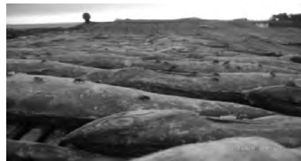
Figure 6 : Le lanhouin est envahi par les mouches.