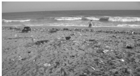
Aspect de l'environnement insalubre à Ayi-guinnou Figure 10