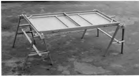
Figure 2 : Caisse fermée.