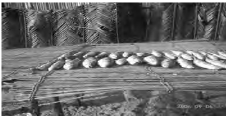
Figure 5 : Aspect d'un séchage de lanhouin à Akpakpa-dodomè.