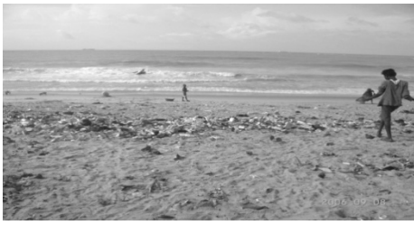
Aspect de l'environnement insalubre à Akpakpa-dodomè Figure 8