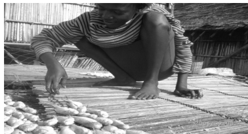
Figure 7 : Pratique non hygiénique du séchage à Akpakpa-dodomè.