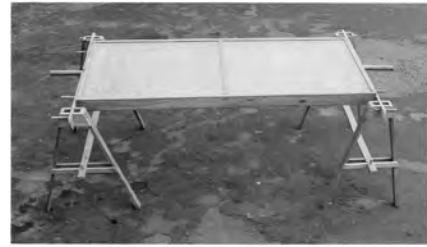
Figure 4 : Caisse pivotée.