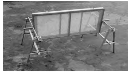
Figure 3 : Pivotement de la caisse.