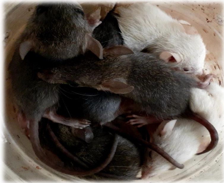
Figure 3: Rattus rattus/Labo-IRBAG-Guinée/A.C/U.K./Bamban.