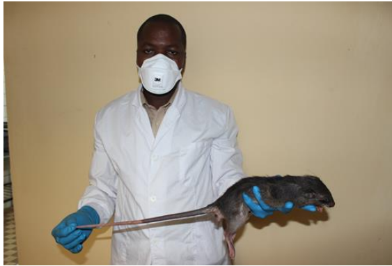
Figure 4: Cricetomys gambianus