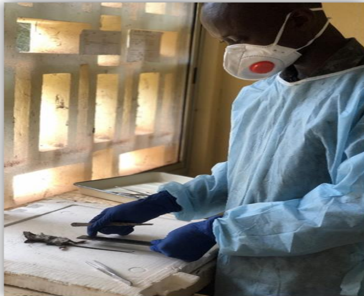
Figure 5 : Rattus rattus /Labo-IRBAG-Guinée/A.C/U.K.