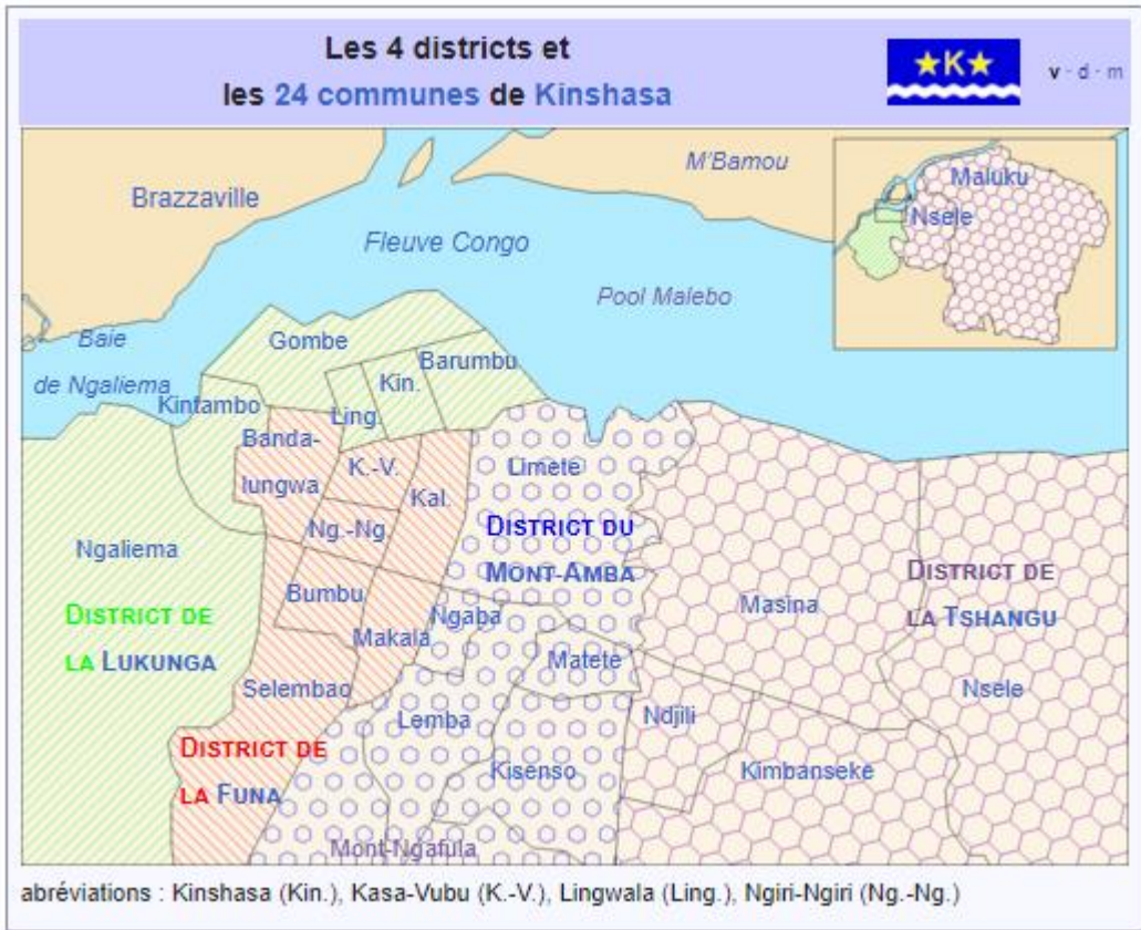
Figure 1: la ville province de Kinshasa.