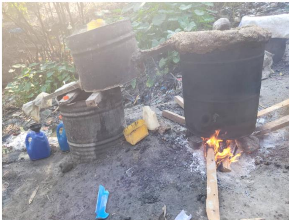
Figure 3: Installation de distillation de Lotoko.