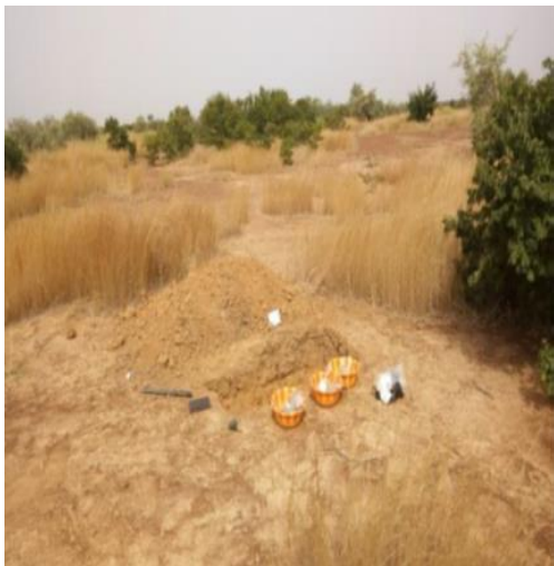
Figure 4 : Environnement du profil.

CE= Conductivité Electrique, C/N= rapport Carbone –Azote, PT= Phosphore total, S= somme des bases, CEC= Capacité d’Echange Cationique, S=Somme des bases échangeables.