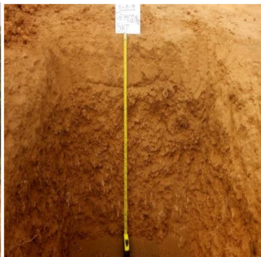
Figure 5 : Profil type de sols.