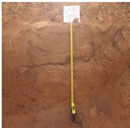
Figure 2 : Environnement de la fosse pédologique Figure 3 : Profil type de sols