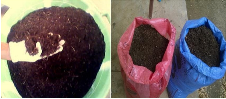
Figure 3 : Compost mûr, tamisé et conditionné en sac.