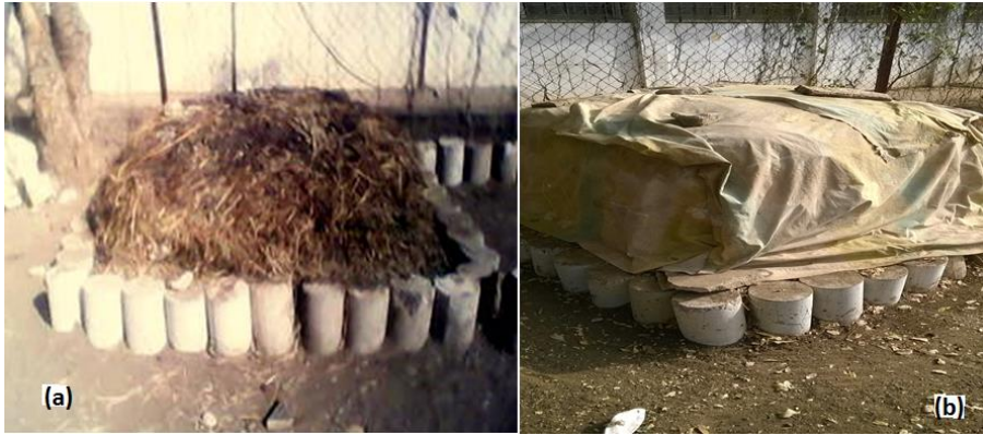
Figure 1: Andain ; (a) en cours de construction ; (b) après construction.