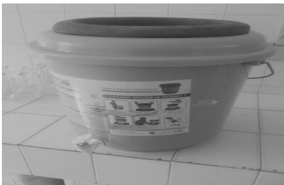
Figure 2 : Filtre en céramique FILTRAO®.

L'application des quatre questions de l'arbre HACCP de décision (Q 1 , Q 2 , Q 3 , Q 4 ) à chacune des étapes pour lesquelles un danger potentiel a été identifié, nous a permis de déterminer les points critiques de contrôle (Tableau 4). Ces CCP se rencontreraient essentiellement aux étapes d'évaluation de la qualité de l'argile, de traitement mécanique des matières premières et de cuisson des pots en céramique.