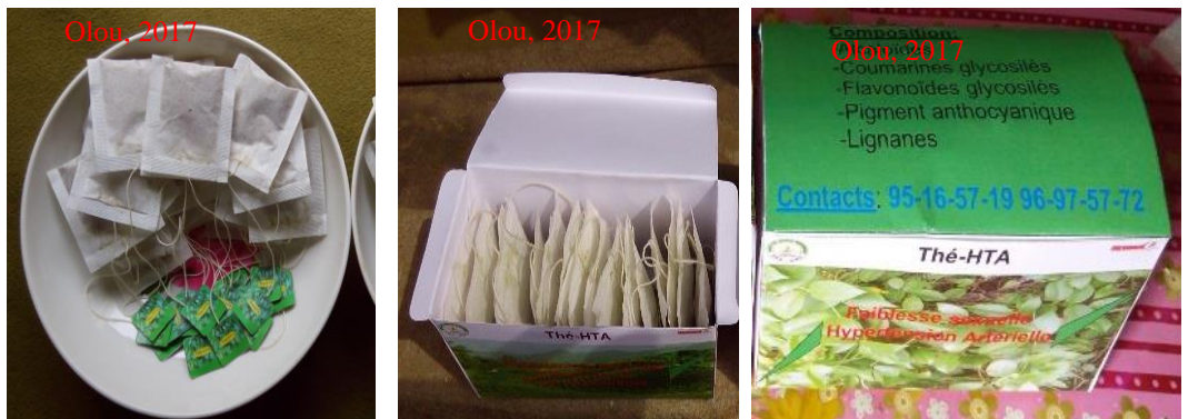
Planche 3 : Etiquetage et mise en carton de thé antihypertensif.