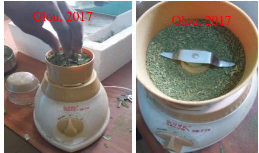
Planche 2 : Broyage