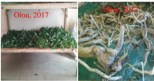
Planche 1 : Séchage des organes