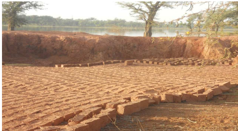
Figure 3 : Confection des briques autour du Lac Bam.