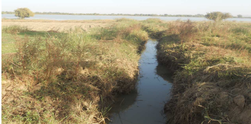
Figure 2 : Creusée de tranchée pour pompage d'eau.