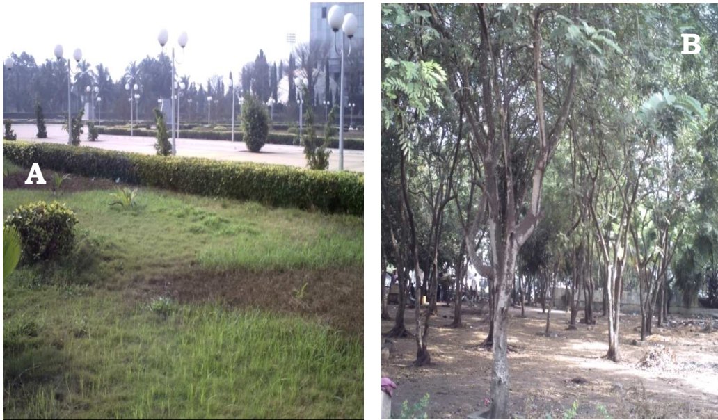
Photo 1 : Espaces verts. A: Place de l'indépendance ; B: Place publique Maman N'Danida.