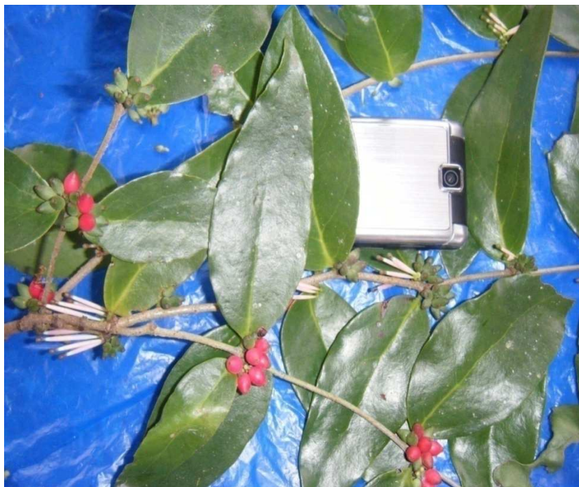
Figure 4: Rameaux florifères et fructifères de Tapinanthus sessilifolius var. glaber (P. Beauv.) Van Tiegh.