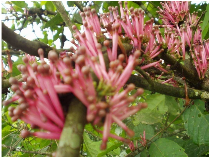
Figure 2: Rameaux florifères de Tapinanthus bangwensis (Engl. et K. Krause) Danser.