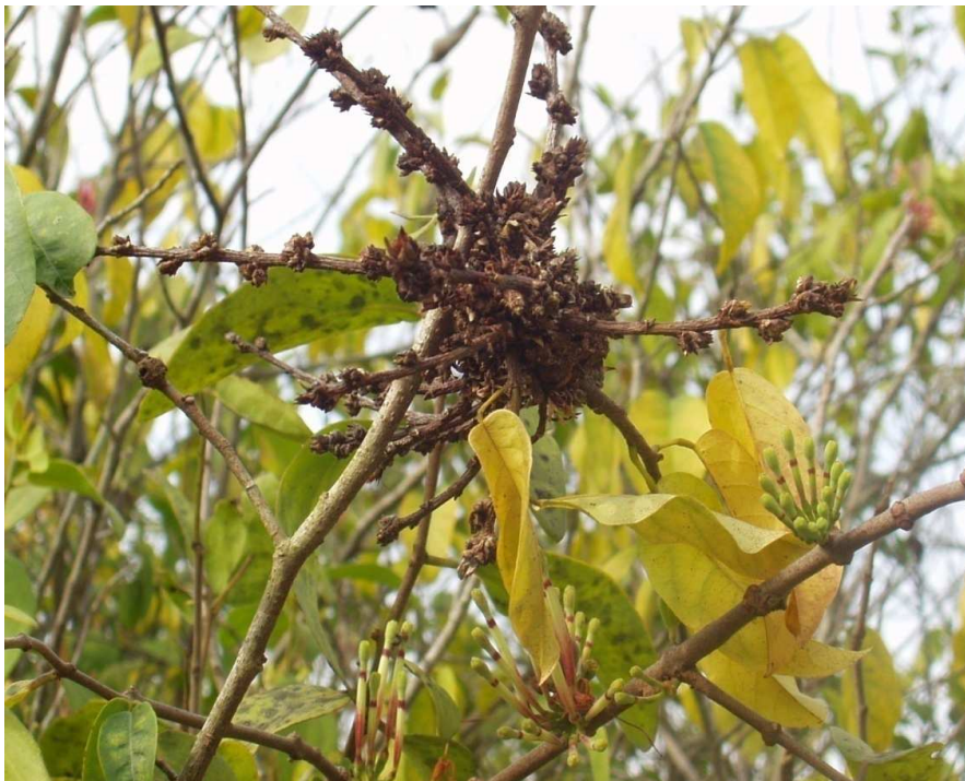
Figure 3: Rameaux feuillés et florifères de Tapinanthus belvisii (D C) Danser.