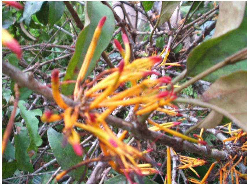
Figure 5: Rameaux florifères de Phragmanthera capitata (Spreng.) Ballé.