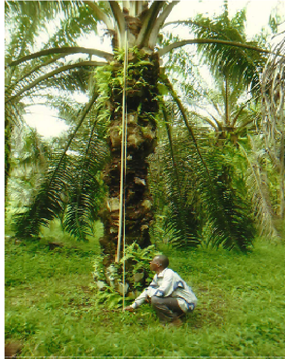
Figure 1 : Mesure de la hauteur du stipe d'un palmier à partir de la base à la feuille 33.