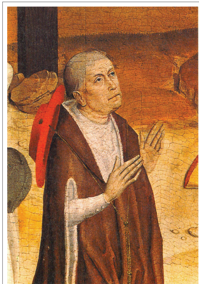
Bron: Anoniem, n.d., Nicolaus Cusanus, Meister des Marienlebens , ca.1463–ca.1490, viewed n.d., from https://de.wikipedia.org/wiki/Datei:Nicholas_of_Cusa.jpg