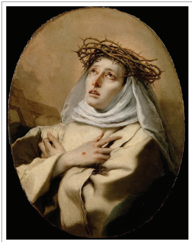
FIGUUR 1: Katharina von Siena, 1746, Giovanni Battista Tiepolo (1696–1770)