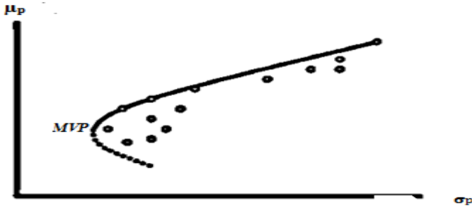
Figure n° 1. Portefeuille de variance minimale et frontière efficiente d'actifs risqués

Source : Adapté de Francis, J.C. & Kim D. (2013) Modern Portfolio Theory: Foundations, Analysis and New Developments . John Wiley & Sons. New Jersey. p.86.