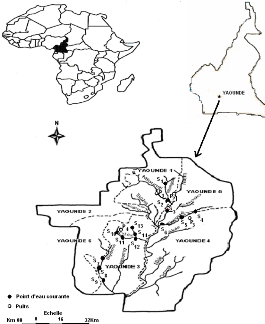
Figure 1: Sites d'échantillonnage (P: puits; S: points d'eau de surface)

Le test de corrélation r de Spearman a été utilisé pour évaluer le degré de liaison entre la présence de souches de chaque espèce de Vibrio et les variations des paramètres physico-chimiques du milieu.