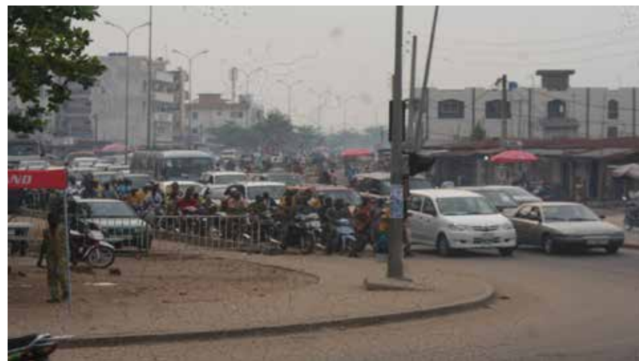
Photo 5 : Embouteillage des motocyclistes sur le tronçon Akossombo-Echangeur Houéyibo dans la matinée

La photo 5 décrit le phénomène de « Go Slow » dans la soirée sur l'un des tronçons retenus au niveau du milieu d'étude.