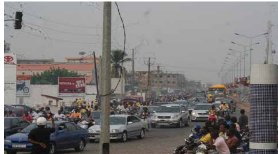
Photo 4 : Embouteillage des motocyclistes sur le tronçon Stade de l'amitié-carrefour Akossombo dans la matinée

La photo 4 vient une fois encore confirmer que l'embouteillage ne se produit pas seulement au niveau des automobiles mais également des motos.