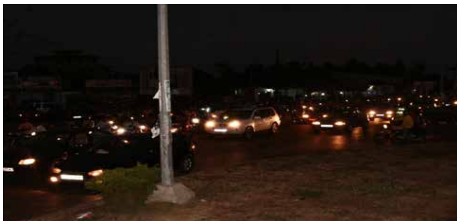
Photo 3 : Embouteillage sur les tronçons Akossombo-Etoile rouge et Akossombo-Echangeur Houéyiho dans la soirée

La photo 3 met en exergue le développement du phénomène de « Go Slow » au niveau des tronçons Akossombo-Etoile rouge et Akossombo-Echangeur Houéyiho qui créent de grands préjudices tant aux usagers qu'aux agents de sécurité chargés de réguler la circulation.