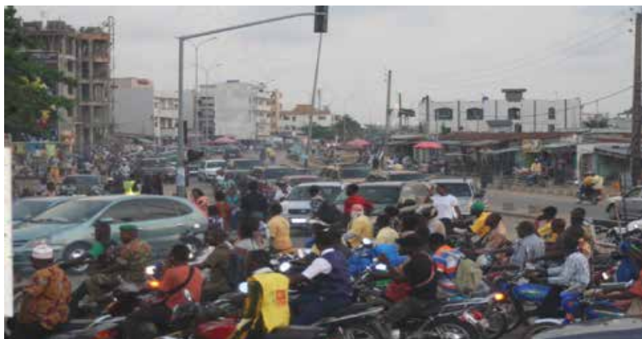
Photo 1 : Embouteillage sur le tronçon carrefour Akossombo-Echangeur Houébiyo dans la matinée Prise de vue Akiyo, octobre 2015.

Le calvaire de la circulation au niveau de la ville de Cotonou devient de plus en plus traumatisant. Ainsi, nous assistons à un spectacle d'embouteillage sur les grands axes comme Echangeur Godomey-Stade de l'amitié, Stade de l'amitié-Carrefour Akossombo, Carrefour Akossombo-Etoile rouge et Akossombo-Echangeur Houéyiho pendant les heures de départ pour le travail et de sorties du service. Il est donc difficile de se rendre à son lieu de travail à Cotonou sans faire des heures dans la circulation. L'attente dans les embouteillages est devenue alors une réalité quotidienne sur ces axes pour de nombreux citoyens, surtout pour ceux provenant d'Abomey-Calavi et ses environs dans le but de vaquer à leurs occupations à Cotonou et à Porto-Novo.