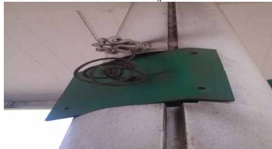
Photo 6 : La fumée produite par la pollution atmosphérique due à l'embouteillage a entraîné le noircissement de certaines infrastructures (poteaux, mur et ampoule) au niveau de station d'essence SONACOP à l'Etoile Rouge de Cotonou

La photo 6 montre l'influence de la pollution atmosphérique sur certaines infrastructures au niveau du carrefour Etoile Rouge à Cotonou.