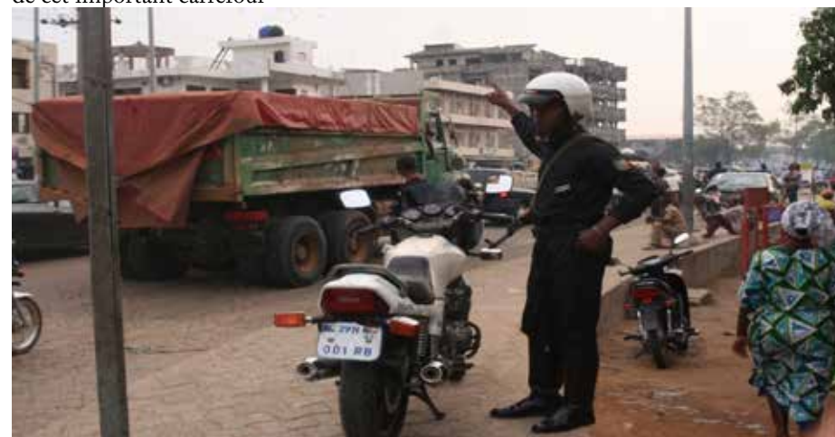
Photo 3 : Stagnation des véhicules au niveau du carrefour Etoile rouge avec ses corollaires dans la matinée sur les usagers et les agents de sécurité

La photo 3 vient illustrer la stagnation des véhicules pendant des minutes au niveau de cet important carrefour