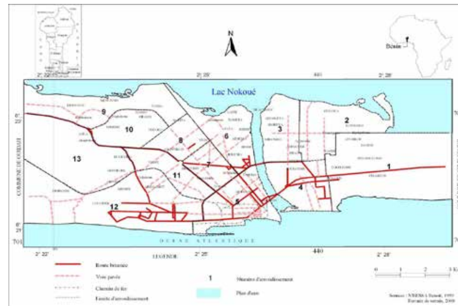
Figure 1 : Situation géographique et administrative de Cotonou

La figure 1 présente le milieu d'étude avec ses différents compartiments administratifs