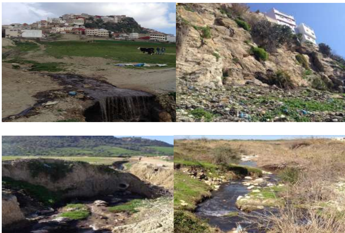
Photos illustrant les formes de dégradation des ressources naturelles

20% des enquêtés font le lien direct entre la diminution des rendements agricoles et la dégradation des ressources naturelles. En effet, l'agriculture de Moulay Driss Zerhoun est une agriculture traditionnelle. La dépendance vis-à-vis les conditions climatiques, l'érosion des sols et l'utilisation non raisonnée des fertilisants et des pesticides entraînent des pertes dans les rendements des cultures.