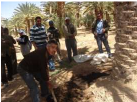
Photo 2. Application du compost, PI d'Erfoud

Les résultats de l'enquête réalisée ont montré que 88 % des enquêtés étaient satisfaits du déroulement des essais car les parcelles répondaient aux critères de sélection retenus et les membres (phoeniculteurs et institutionnels) s'impliquaient activement traduisant la volonté de « faire ensemble » pour la réussite de cette expérimentation.