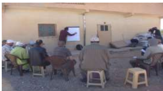
Photo 1. Session de formation sur la fertilisation du palmier dattier, PI Tineidade

une fluidité dans les discussions. Ils ont plus apprécié le caractère pratique de la formation qui leur a permis de comprendre que faire et comment le faire. En effet, pour la fertilisation organique, ils se sont exercés sur le calcul des quantités de compost à apporter par pieds. Pour la lutte contre la cochenille, ils ont appris les méthodes de lutte, le produit à utiliser et l'époque de son application. Ce qui montre que la PI est un espace de conseil rapproché relatif à de nouvelles techniques et de formation de ses membres.