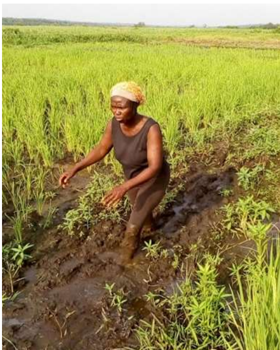
Photo 1. productrice de riz (Glazoué, département des Collines, Juillet 2018)

Le présent article vise à répondre à ces questions et teste l'hypothèse selon laquelle les contrats affectent différemment les hommes et les femmes. Après avoir examiné l'inclusion ou non des femmes aux contrats agricoles, l'article analyse et compare l'impact des contrats sur les riziculteurs hommes à celui des femmes productrices de riz.