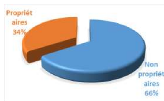
Figure 2. Statut foncier des femmes

Alors que la constitution ivoirienne et les lois relatives à la succession et à la propriété privée placent la femme sur le même pied que l'homme, les normes coutumières régissant la gestion foncière dans la société Gblo de la sous-Préfecture de Languibonou l'excluent presque de la propriété foncière. Cette situation s'explique en partie par le fait que la loi reste peu appliquée à l'échelon national. La Figure 2 répartit les femmes selon leur statut par rapport aux terres qu'elles exploitent.