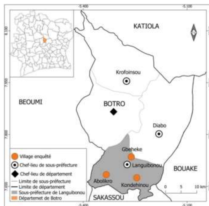
Figure 1. Localisation de la zone d'étude

Les femmes constituent la cible principale de l'étude. Elles ont été interrogées à l'aide d'un questionnaire articulé en trois parties : identification de l'enquêtée, mode d'accès à la terre, mise en valeur de la terre et situation socioéconomique des femmes. Un effectif de 105 femmes a été enquêté pour les trois localités, à raison de 35 par village. Cet échantillon a été constitué au moyen de la technique de choix aléatoire. Pour faire partie des répondantes, les femmes devaient être agricultrices. Elles ont été interrogées, seules en aparté, en l'absence de leurs époux ou de personnes pouvant influencer leurs réponses.