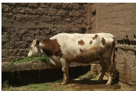
Photo 2. Elevage bovin (vache laitière de race Montbéliarde alimentée avec de la luzerne)

UGB totales). La production laitière est limitée, eu égard au potentiel des vaches de type croisé : 5 litres/jour par vache en lactation. Le lait est vendu à la coopérative locale de transformation. Le travail est assuré exclusivement par de la main d'œuvre familiale. Les sources de revenus sont diverses et comprennent, outre les ventes du henné, des dattes et du croît animal, les versements des membres de la famille ayant une activité extra agricole (photo 2).