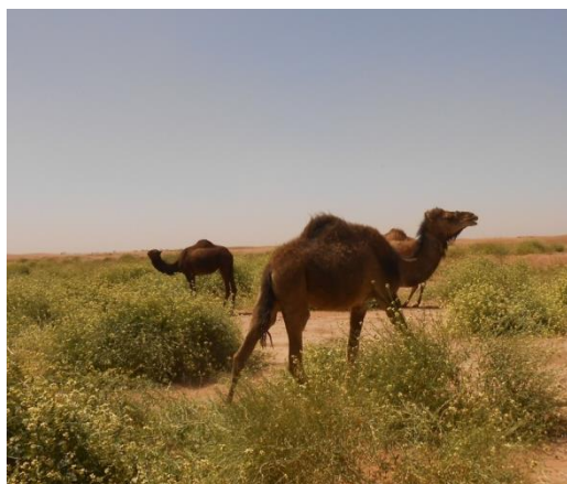
Photo 4. Elevage pastoral (dromadaires dans la zone dite Oued Nâam, Mhamid El Ghizlane)