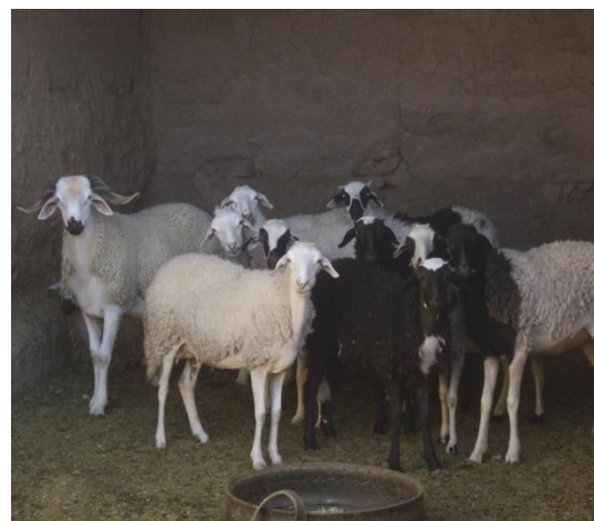
Photo 3. Elevage ovin intensifié (brebis suitées de la race D'man)

Le type 4 « Elevage pastoral » est représenté par une exploitation située à l'extrême aval de la vallée (localité de Mhamid El Ghizlane) d'une surface de 1 ha, cultivant 120 palmiers dattiers, de la luzerne (0,1 ha) ainsi que des céréales (0,4 ha). Le troupeau est constitué de 17 chamelles. Elles sont conduites sur les parcours avoisinants, sans gardien. De ce fait, elles sont distinguées par un système de marquage grâce auquel chaque éleveur reconnaît son troupeau. Les revenus de l'exploitation dépendent des ventes des chamelons : 4 sont sevrés en moyenne par an et vendus à un prix moyen individuel de 12 000 DH complétés par les activités extra-agricoles des fils du propriétaire (photo 4).