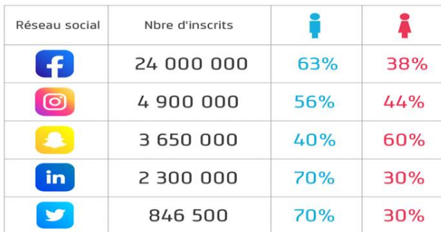
Figure 2. Chiffres clé de Facebook en Algérie

Ces travaux ont justement pu dépasser la vision non dualiste et logocentrique (Paveau, 2013) des discours numériques. Ainsi, l'intention est plus focalisée sur les phénomènes qui caractérisent l'espace technodiscursif algérien sur les médias sociaux Facebook, Twitter et autres. L'article de Benaldi Hassiba (2021) explore les manifestations du pathos dans les stratégies technodiscursives des facebookers pendant la pandémie de la Covid-19. Elle analyse comment la dimension pathémique se construit et se manifeste dans les technodiscours des internautes algériens pour sensibiliser contre la covid-19. Les hashtags comme nouvelles modalités de discours rapporté est l'objet de l'article de Medane (2020), elle propose une analyse discursive du hashtag #Non aux africains en Algérie # لا للأفارقة في الجزائر comme catalyseur d'une campagne de mépris et de haine envers les réfugiés subsahariens en Algérie. Elle propose d'analyser suivant les cadres théoriques de l'AD et de