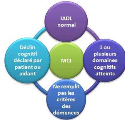
Figure 1: caractéristiques du MCI