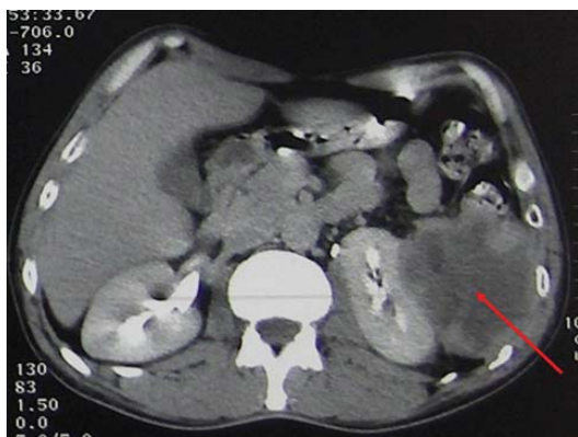
Fig. 1: Tomodensitométrie abdominale avec injection de produit de contraste : la tumeur se rehausse en périphérie par le produit de contraste et repousse le rein gauche vers l'avant.

à un léiomyosarcome de la capsule rénale, envahissant, la rate et le colon, avec des limites de résection saines. Avec un recul de 6 mois, une récurrence locale asymptomatique a été diagnostiquée par un scanner abdominal (Fig. 3). Le patient a été repris par voie médiane. Des nodules péritonéaux ont été découverts dont l'examen anatomopathologique avait conclu à une carcinose péritonéale. Une abstention thérapeutique a été décidée et la patiente est décédée 14 mois plus tard.