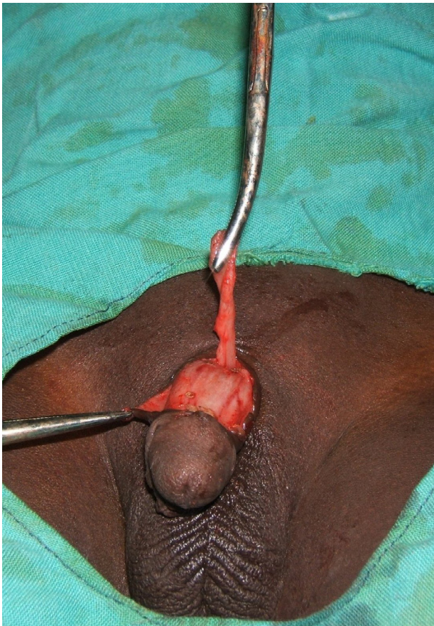
Figure 2 Vue opératoire: L'urètre accessoire épispade est présenté verticalement à l'aide d'une pince, après sa dissection. Operative view: After dissection, the epispadiac urethra is presented vertically.

tablier préputial ventral pour en faire un enfant circoncis (Figure 3). Aucun drainage urinaire n'a été mis en place. Les suites opératoires ont été simples. L'examen histologique de la pièce opératoire a mis en évidence un épithélium de type excréto-urinaire et une paroi constituée de cellules musculaires lisses. Après deux ans de recul, aucune plainte n'a été rapportée, les érections matinales sont conservées, les urines sont restées stériles et l'aspect cosmétique de la verge a été jugé bon.