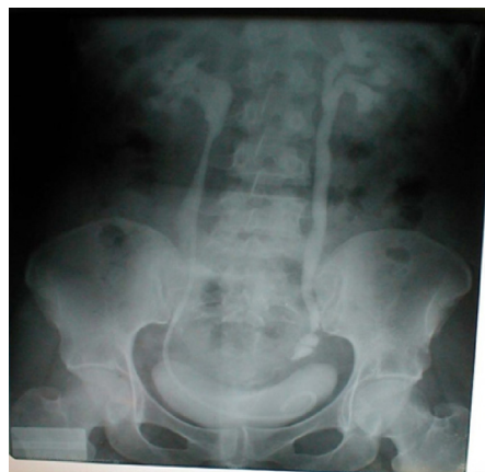
Figure 3 UIV montrant une dilatation pré sténotique après section-ligature de l'uretère pelvien gauche. A droite, l'uretère a été réparé, sonde JJ en place.