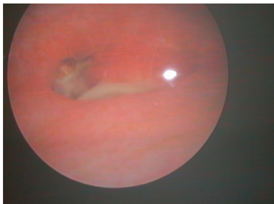
Figure 2 Image cystoscopique d'une fistule vésico-utérine latérale droite.