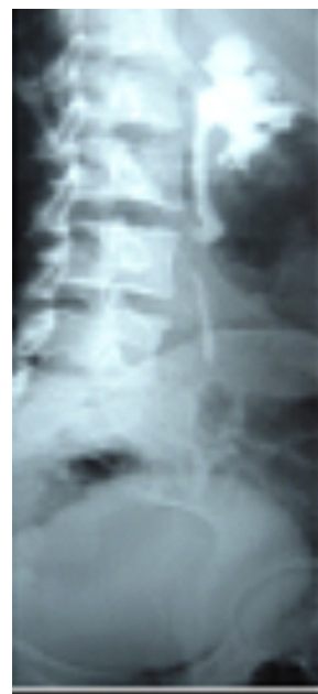
Figure 2 (vue de face) UIV montrant une hydronéphrose modérée associée à un uretère rétrocave droit.

trois fois par jour, d'une restriction hydrique et d'une antibiothérapie pendant cinq jours fait de Ceftriaxone 1 g en intra veineuse matin et soir et de Gentamicine, 160 mg en intra musculaire en injection unique. Cette antibiothérapie fut poursuivie pendant deux semaines avec la Ceftriaxone seule après que l'antibiogramme ait isolé Escherichia coli sensible à la Ceftriaxone. Une montée de