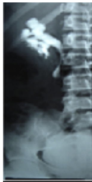
Figure 1 UIV montre une hydronéphrose droite modérée associée à un uretère rétrocave droit.

La patiente a bénéficié en urgence d'un traitement anti inflammatoire en intra veineuse directe à base de ketoprofène 100 mg deux fois par jour pendant trois jours, associé à un anti spasmodique, le Phloroglucinol 80 mg en intra veineuse à raison d'une ampoule