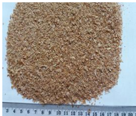
Figure 3 : Son de blé.