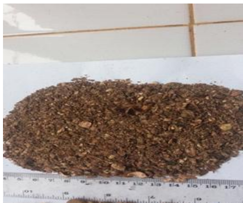
Figure 2 : Pellicules de cajou.

physiques indésirables et séchés à l'étuve à 120° C pendant 10 minutes ( retournés après chaque 5 minutes ) comme le montre la Figure 2 ; de son de blé acheté dans le commerce sur le marché local de la ville de Daloa ( Côte d'Ivoire ) comme indiqué sur la Figure 3.