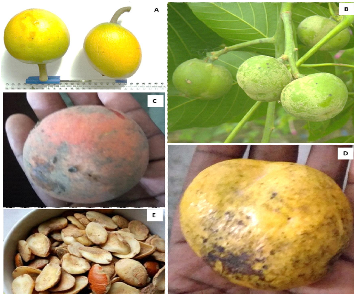
Figure 2 : Fruits et/ou graines de quelques espèces végétales conservées dans les plantations de palmiers à huile autour de la FMTE ; A- Tieghemella heckelii (makoré) ; B- Ricinodendron heudelotii (Akpi) ; C- Garcinia kola (petit cola) ; D-E- Fruit et graines de Irvingia gabonensis (manguier sauvage, kaklou).

Fruits and/or seeds of some plant species conserved in oil palm plantations around the FMTE; A- Tieghemella heckelii (makoré); B- Ricinodendron heudelotii (Akpi); C-Garcinia kola (small cola); D-E- Fruit and seeds of Irvingia gabonensis (wild mango, kaklou).