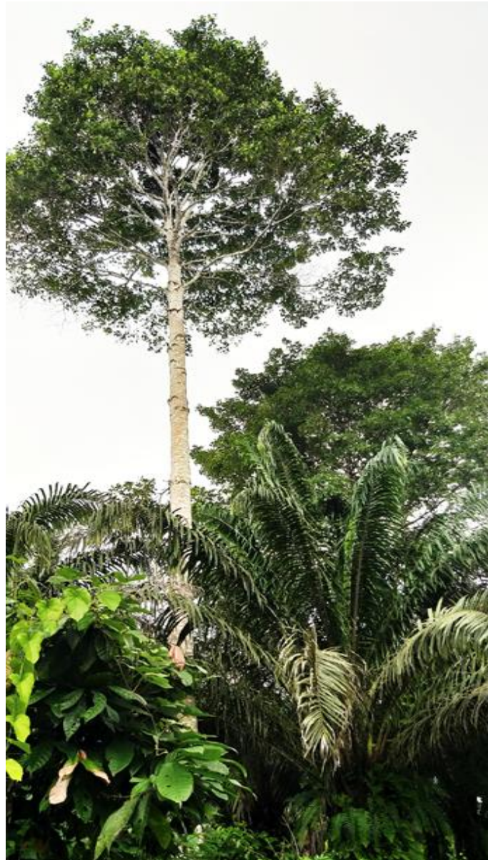
Figure 3 : Association du palmier à huile et du makoré ( Tieghemella heckelii ) dans le village de Kongodjan-Tanoé.

Association of oil palm and makoré ( Tieghemella heckelii ) in the village of Kongodjan-Tanoé.