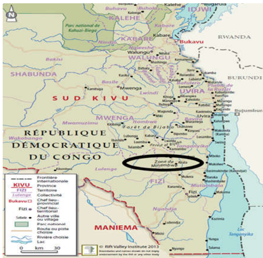
Figure 1 : Localisation géographique de la zone de Minembwe dans le territoire de Fizi au Sud-Kivu. Geographical location of the Minembwe area in the territory of Fizi in South Kivu.