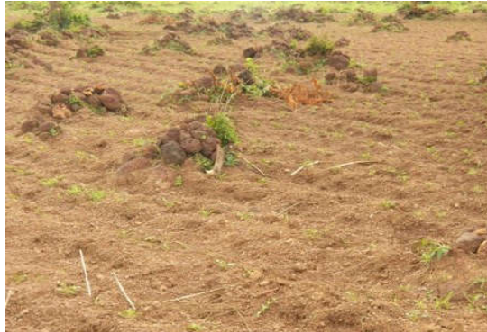
Figure 2 : Tas de pierres. Pile of stones.

créer des retenues d'eau dans les champs et de gérer la fertilité des sols. Le paillage du sol est une méthode également utilisé par les