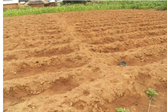
Figure 3 : Diguette en billon. Diguette in ridges.

producteurs pour la conservation de l'humidité du sol (21 %). Toutes ces formes de conservation des eaux et des sols rencontrés