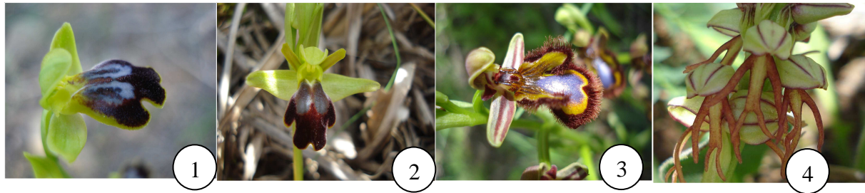
Figure 2 : Orchidées d'El Haourane : 1. Ophrys marmorata G. Foelsche & W. Foelsche, 2. Ophrys fusca Link, 3. Ophrys speculum Link, 4. Orchis anthropophora (L.) Allioni