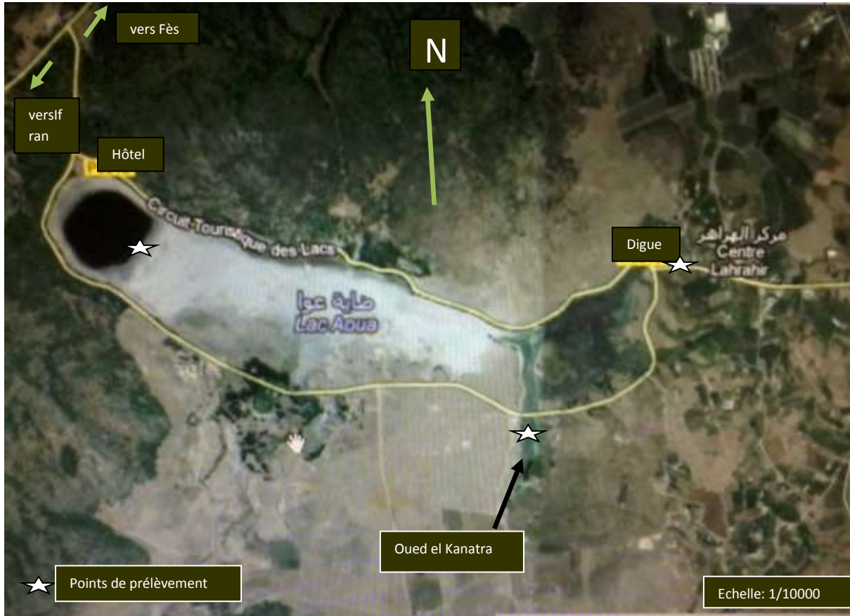
Figure 1 : Site et point de prélèvement.