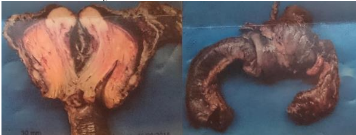
Figure 4. Vue macroscopique de pièces opératoires d'invagination intestinale

Les pièces opératoires ont confirmé la présence d'une masse d'interpénétration d'anses intestinales (figure 4).