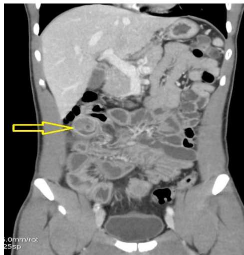
Figure 2. Reconstruction coronale d'un scanner abdomino-pelvien, montrant une image en cocarde du flanc droit en sous-hépatique (flèche jaune) évoquant un boudin d'invagination de type iléo-iléal