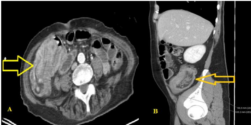
Figure 3. Coupe axiale (A) et reconstruction sagittale (B) d'un scanner abdominal, montrant une image de masse dans la fosse iliaque droite (flèche jaune), faite d'intussusception d'anse digestive, « image en sandwich », évoquant un boudin d'invagination de type iléo-caecal Le scanner a rapporté des causes organiques chez trois patients, dont la première une masse solide péritonéale de 36 mm de grand axe, la seconde de multiples adénopathies péritonéales et la troisième une appendicite en amont de laquelle se trouvaient les boudins d'invagination.

Sur le plan thérapeutique, 5 patients (19%) ont été opérés en raison de l'état occlusif, avec résection et on observait une désinvagination spontanée chez 21 patients (81%) après surveillance clinico-échographique, dont les rythmes étaient tributaires des signes cliniques des patients.