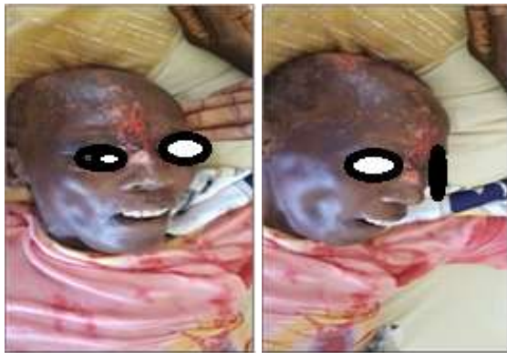
Figure 1. Eruption cutanée suivant le trajet de la branche ophtalmique du nerf trijumeau (zona ophtalmique)

Une femme de 64 ans droitrière a été hospitalisée pour une altération de l'état général, trouble du comportement, rash cutanée fronto-orbitaire droite avec ptose palpébrale ipsilatérale (figure 1) et des céphalées. La patiente était ménagère et immunocompétente. La famille a rapporté au cours des deux semaines précédant l'hospitalisation, un changement de comportement, des troubles mnésiques antérogrades d'installation brutale, et des épisodes d'hyperthermies. Il y avait aussi une éruption cutanée fronto-orbitaire d'apparition brutale associées à des céphalées frontales sans nausées et vomissements Elle a également présenté une agitation psychomotrice suivie d'une perte de la connaissance sans antécédents particuliers connus. A l'examen physique, c'était une patiente agitée, téguments et muqueuses étaient normo-colorés avec un état général altéré La pression artérielle était de 180/100 mmHg, la température 37,9 degré Celsius et une fréquence cardiaque de 116 battements par minute. On notait une agitation psychomotrice avec une désorientation temporo-spatiale, une ptose palpébrale droite. L'examen cutané, montrait une éruption de type zostérienne intéressant le dermatome de la branche ophtalmique du nerf trijumeau à droite (figure 1).