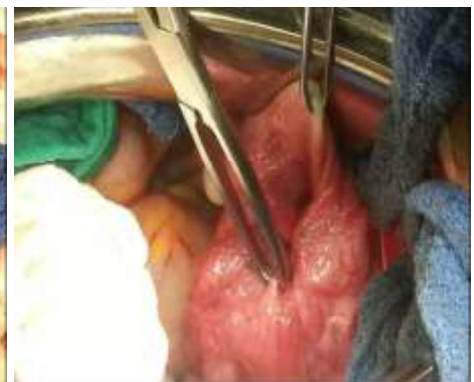
Figure 3. Désinvagination progressive en tractant sur les ligaments ronds.