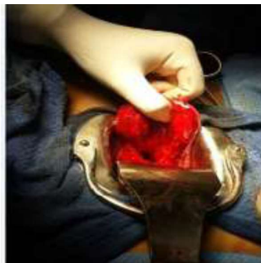
Figure 4. Hystérotomie postérieure.