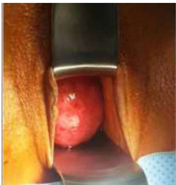
Figure 1. Masse rouge prolabée à travers le col utérin faisant rappeler l'endomètre

Tous les auteurs ont contribué équitablement à la rédaction et la révision de ce manuscrit.