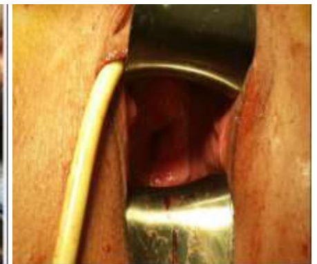
Figure 6. Vue post opératoire. Aspect normal du col avec remise en place du fond utérin.