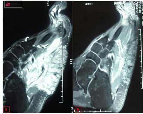
Figure 3. A: Image par resonance magnétique de la complication osseuse du mycétome avant le traitement ; B: Image par resonance magnétique de la complication osseuse du mycétome après 12 mois du traitement