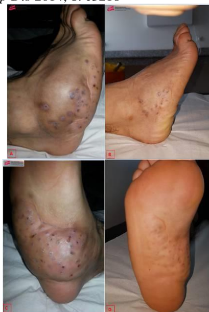
Figure 1. A, C : Mycétome du pied (aspect pseudotumoral polyfistulisée) ; B, D : Aspect clinique après 12 mois de traitement