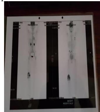
Figure 7. Scintigraphie du corps entier à l'Iode 135 montrant une hyperfixation à l'extrémité inférieure du fémur, la rotule et le tibia ainsi que pulmonaire.

En définitif, ce patient de 14 ans a présenté un ostéosarcome du fémur droit avec métastases pulmonaires (stade 4) ayant bénéficié d'une prise en charge multidisciplinaire en milieu mieux équipé. En Inde, la kinésithérapie associée à la chimiothérapie a amélioré la qualité de vie du patient en levant l'impotence fonctionnelle. Après 6 mois de prise en charge en Inde, le patient est rentré à Kinshasa, marchant normalement sans appui ni boiterie ; avec un gain pondéral de 13 kg (38 kg à 51 kg). Le patient sera perdu de vue pendant près de 18 mois. En effet, le patient avait en réalité interrompu la chimiothérapie au profit d'une médecine alternative (de nature ignorée) avec