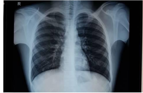
Figure 5. Radiographie du thorax (face) standard : Absence d'anomalie lésionnelle