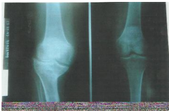
Figure 3. Obliquité des interlignes articulaires fémoro-tibiaux après ostéotomie tibiale haute de varisation pour gonarthrose en varus, en lieu et place de l'ostéotomie fémorale basse de varisation

Les résultats fonctionnels de ces ostéotomies tibiales hautes indifféremment réalisées pour genou valgum ou varum sont comparables. La consolidation clinique et radiographique des ostéotomies a été obtenue en moyenne au 149ème jour postopératoire, date de l'ablation du cadre de Charnley. Les radiographies postopératoires ont mis en évidence des obliquités importantes des interlignes fémoro-tibiaux qui curieusement ne se traduisent pas cliniquement par des signes d'instabilité des genoux ou des luxations fémoro-tibiales attendues (figure 3).