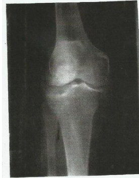
Figure 1. Gonarthrose stade 4 de Koshino

Les paramètres d'intérêt englobaient les données cliniques (âge, sexe, examen physique), morphologique (radiographie), thérapeutiques (OTH associée à la Kinésithérapie). Tous les patients inclus dans la présente étude présentaient une gonarthrose fémoro-tibiale et patellaire avancées sur genou désaxés en valgus ou en varus, indications classiques des prothèses totales du genou (figure 1).