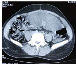
Figure 1. Image tomodensitométrique d'une rate ectopique avec loge splénique vide

A l'examen clinique, la patiente était stable sur le plan hémodynamique et respiratoire avec une fébricule à 38,2°. La palpation profonde objective une défense au niveau de l'hypochondre gauche, avec une masse épigastrique étendue, au flanc gauche mesurant 15/7cm douloureuse, de consistance ferme, mobile et mate à la percussion. L'échographie abdominale était gênée par la présence des gaz digestifs, mais elle a suspecté la torsion d'une rate ectopique devant la vacuité de la loge splénique et la présence d'une masse épigastrique non vascularisée au doppler. La tomodensitométrie abdomino-pelvienne avait montré une splénomégalie compliquée de torsion pédiculaire (figure 1).