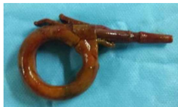
Figure 3. Image de l'anneau gastrique après son extraction

Le geste chirurgical était l'ablation de l'anneau gastrique (figure 3) avec une résection grêlique emportant les deux perforations avec anastomose grêlo-grêlique termino-terminale. Les suites post-opératoires étaient simples. Le recul est de 5 ans.