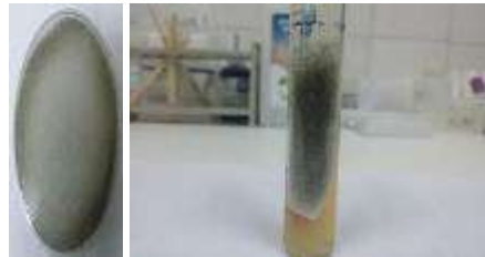
Figure 3. Image montrant les cultures ensemencées en milieu de Sabouraud d'allure cotonneuse de couleur blanche puis grise tandis que le verso est incolore

A la culture en milieu de Sabouraud des colonies très expansives, de couleur blanc-gris, envahissaient rapidement tous les milieux de culture (figure 3). Cet aspect orientait vers un champignon filamenteux de l'ordre des Mucorales appartenant au genre Rhizopus .