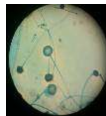
Figure 4. Photo montrant l'aspect microscopique après 2 jours de culture sur milieu de Sabouraud par technique du drapeau

Afin d'exclure une contamination superficielle et transitoire par cette moisissure, une biopsie profonde était pratiquée. L'examen direct a montré des filaments larges, non septés, ramifiés et à angle droit révélant la présence d'un champignon zygomycète. Les cultures de ces prélèvements cutanés ensemencés en milieux de Sabouraud étaient rapidement extensives d'allure cotonneuse envahissant tout le tube et la boîte de pétri. Microscopiquement des grands sacs sporogènes appelés sporocystes rempli de spores de grande taille se trouvent à l'extrémité de sporocystophores allongés et disposés en bouquet, de nombreuses structures en racine, appelées rhizoïdes, sont caractéristiques du genre Rhizopus (figure 4). Ainsi le diagnostic d'une mucormycose cutanée à Rhizopus oryzae était retenu.