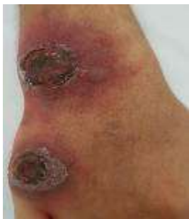
Figure 1. Photo montrant deux lésions cutanées nodulo-croûteuses et nécrotiques de la face dorsale de la main droite

Enfant âgé de 11 ans vivant en milieu rural, issue d'un mariage non consanguin, d'un père agriculteur et d'une mère managère, suivi pour aplasie médullaire sévère selon les critères de Camita mis sous ciclosporine à la dose de 4mg/kg/j avec rémission partielle, en attendant l'allogreffe de moelle. L'enfant est admis aux urgences pour syndrome infectieux fait de fièvre chiffrée à 39°C isolée sans autres signes associées avec un bilan infectieux négatif (notamment un ECBU stérile, une radiographie du thorax normal, hémoculture stérile et une CRP normale) et l'échec de l'antibiothérapie probabiliste (ceftriaxone+amikacine). Durant son hospitalisation, l'évolution était marquée par l'apparition de deux lésions cutanées de 2 cm de diamètre nodulo-croûteuses et nécrotiques de la face dorsale de la main droite (figure 1).