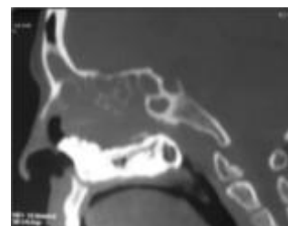
Fig. 2 : TDM reconstruction sagittale : Formation nasale droite de tonalité calcique