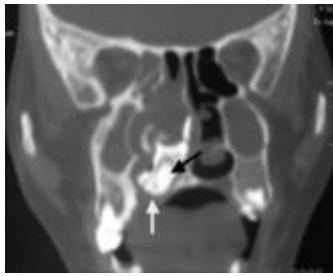
Fig. 4 : TDM coupe coronale : Formation nasale droite de tonalité calcique (flèche noire) avec lyse du palais osseux (flèche blanche) et comblement naso-sinusien

Un traitement médical à base d'antibiotiques (Amoxicilline - Acide clavulanique) et des lavages nasaux au sérum physiologique ont été prescrits chez tous les patients en préopératoire pendant 48 heures.