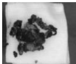
Figure 5: Aspect des rhinolithes après extraction

La surveillance endoscopique chez tous les patients n'a pas révélé de récurrence de la rhinolithiase.