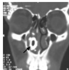
Fig. 3 : TDM coupe coronale : Formation nasale droite de densité métallique avec lyse de la cloison nasale